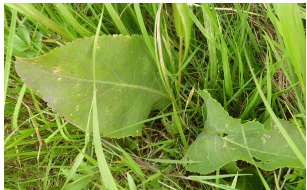
Peperkers - rozetblad