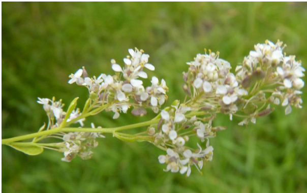
Peperkers - bloeiwijze

uitvallen omdat veel soorten net buiten de hok-grenzen werden gevonden zoals Groene amarant ( Amaranthus hybridus ), maar ook gewone soorten als Moerasandoorn ( Stachys palustris ). Het meest opmerkelijk was vlakbij het spoor een forse groeiplek van Esdoornganzevoet ( Chenopodium hybridum ). Samen met Kleine leeuwenbek ( Anthirrinum minor ) op een parkeerterrein in een zandige, schelprijke berm, vlak bij het station Koog-Zaandijk.