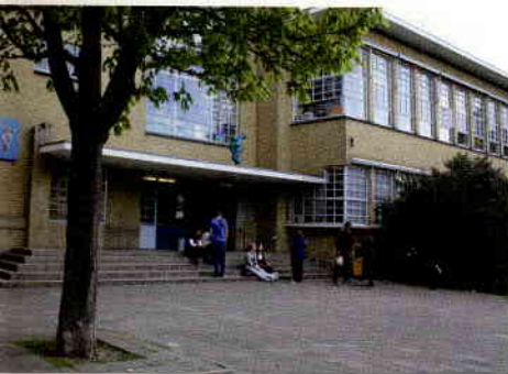
Utrechts Stedelijk Gymnasium.

Op het USG werkten de natuurkunde-docenten jarenlang met Scoop , totdat die methode in 2006 ging stoppen. Kleijne: "Toen hebben we overhaast voor de methode Pulsar gekozen, maar we werden er niet blij van. Ik vond de vragen in Pulsar te makkelijk, er zat niet genoeg uitdaging in en het ICT-gedeelte viel tegen. Toen hoorden we over het NiNa-project. Ik vond het een kans om van dichtbij zo'n vernieuwing mee te maken. Een aantal aspecten van NiNa spraken me aan. De moderne natuurkunde komt aan bod en ik vind dat belangrijk. We hebben jarenlang meegedaan aan het Project Moderne Natuurkunde , maar in die tijd stopte dat ook. Dat project was voor leerlingen best pittig, maar ze vonden het boeiend. Wij hebben sowieso altijd leerlingen die vragen wanneer we iets met quantummechanica of met relativiteit gaan doen. Allemaal dingen waarvan je denkt: 'dat kan toch helemaal niet op de middelbare school!' In het Project Moderne Natuurkunde bleek het allemaal wel goed mogelijk."